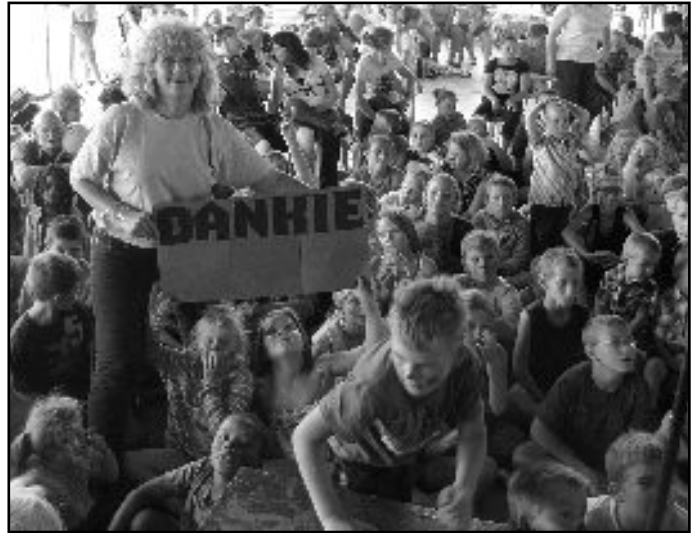
Kinderdag in Pretoria

Op Saterdag, 23 Oktober 2010 is 437 minderbevoorregte kinders uit die plakkerskampe wes van Pretoria, asook die kinders van Huis Jakaranda en Huis Louis Botha is by die Voortrekkermonument Erfenisterrein trakteer met 'n dag vol pret.