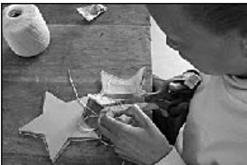
'n Ster vir Kersfees!

Naskrif: Die VVA gaan help om die biblioteek van Petunia Primêr uit te bou om ook 'n leeskuil onder hierdie leerders te help vestig. (-AdeS)